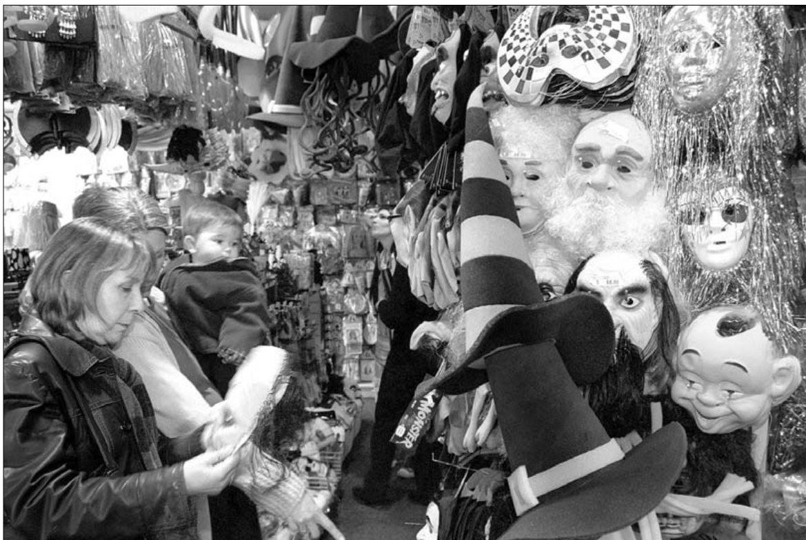
CELTA. Los colegios ingleses empezaron a festejar Halloween hace 10 años. La fiesta y el negocio se han extendido